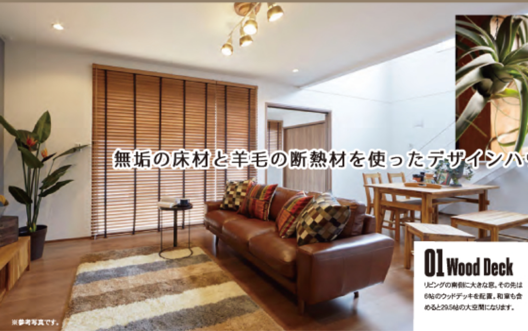
無垢の床材と羊毛の断熱材を使ったデザインハウス