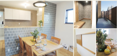
【東成区中本4丁目2区画 物件概要】

今週の 土・日 AM10・PM5 「普通の建売住宅とは、違う」と必ず体感できるでしょう!