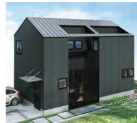
COURT HOUSE 1,200万円