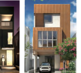
FLAT3 inner GAREAGE 1,600万円