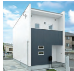
ZERO-CUBE RECT 800万円