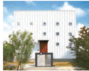
ZERO-CUBE KAI ACT2 1,400万円