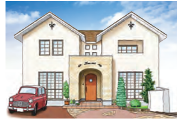
LA BELLE EQUIPE 1,300万円