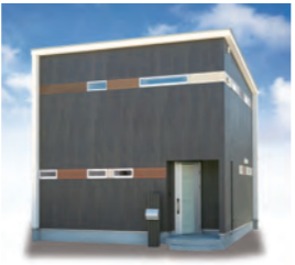
Smart Line 900万円