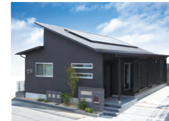
スマートハウス四季 2,180万円