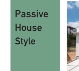
BLOSSOM 03 1,600万円