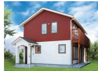
NORDIC HOUSE 1,300万円