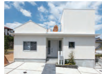
CROSS LAYERD 2,080万円