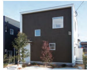
ZERO-CUBE SIMPLE STYLE 900万円