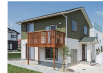
HYVA AND STYLE 1,200万円