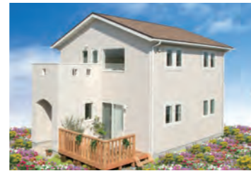
Blanc Ange 1,200万円