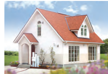
SWEET HOME 1,111万円