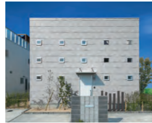
ZERO-CUBE KAI カスタム 1,300万円