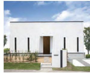
ZERO-CUBE KAI ACT1 1,200万円