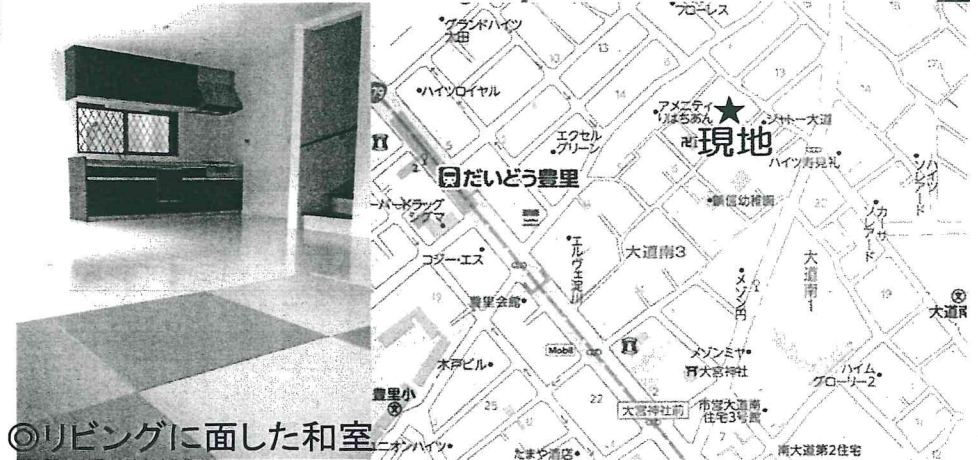
◎リビングに面した和室